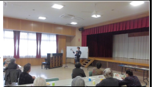
4/11 高齢者に対する緊急安全講話

道路を横断する際は、①「止まって」安全確認を行い、②しっかり右「見て」左「見て」もう一度右を「見て」③手を上げるなど「合図を出して」④車が止まるのを「待って」から渡りましょう!