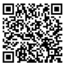
福岡県警察採用サイト

受付期間中に右記QRコードから福岡県警察採用サイトにアクセスし、受験案内と受験申込要領をよくご確認の上、申込手続を行ってください。