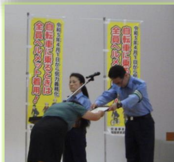
校長先生へ指定書交付